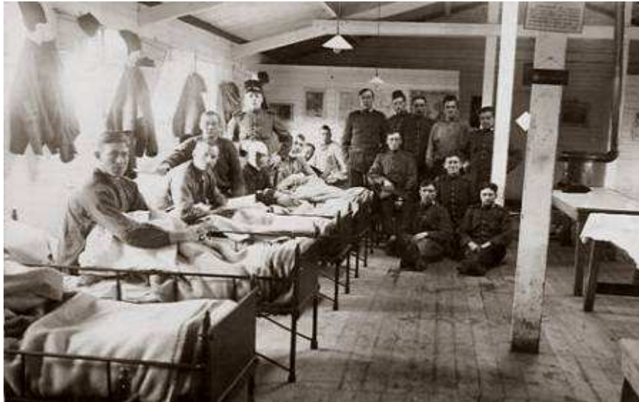
Een voorbeeld van een Nederlandse militaire barak ten tijde van de mobilisatie 1914/18.

Alle pelotons hadden alarmopstellingen voorbereidt die in 365 graden op het eiland waren gedimensioneerd. Mocht het noodzakelijk zijn dan konden deze met het overige personeel (of ze nu sliepen of stand-by waren) na een alarm snel bezet worden.