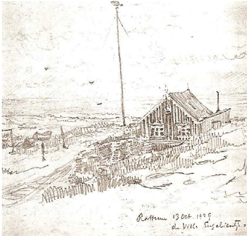
Villa Engelina in 1929.

Het duurde tot 14 maart 1940 tot er weer Nederlandse militairen op Rottumeroog werden gelegerd. In nieuwe houten barrakken, terwijl er in 1930 nog een plan was gelanceerd om een regulier fort op het eiland te bouwen. Dat plan werd toen al snel naar de prullenbak verwezen.