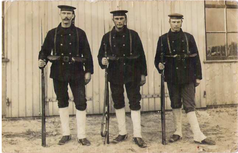
Tenue en bewapening van de mariniers in 1914 (hier op Schiermonnikoog).